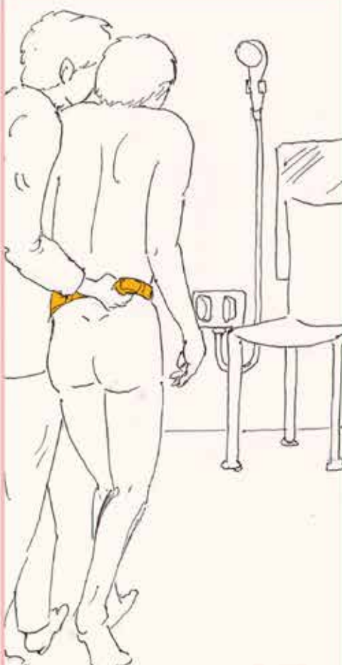
シャワーでの介助