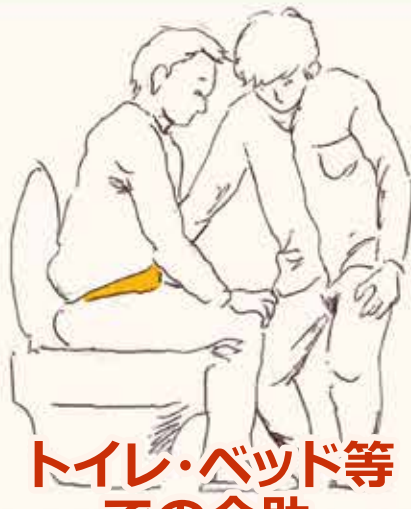
トイレ・ベッド等 での介助